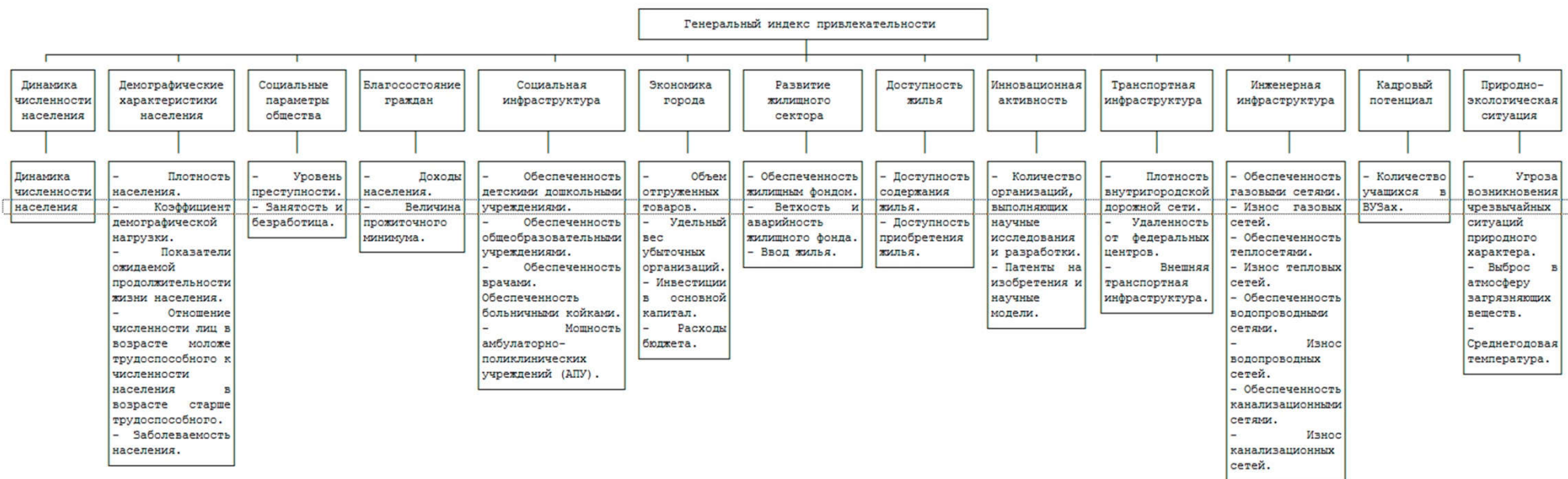
Рис. 2. Структура показателей, на основе которых получен ГИПГ