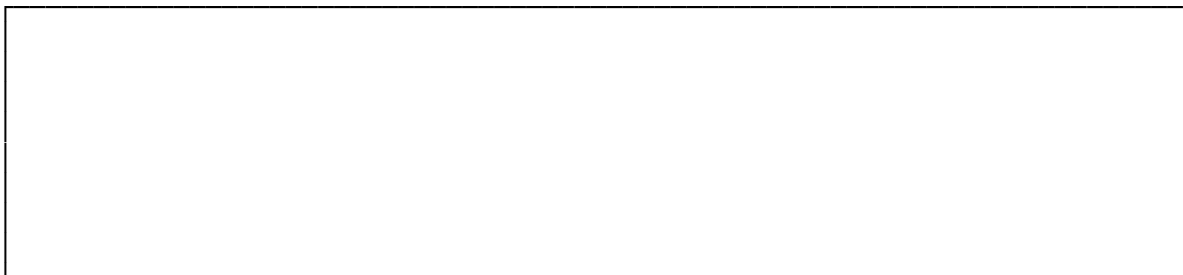
Схема размещения рекламного места

Рекомендуемый внешний вид рекламной конструкции